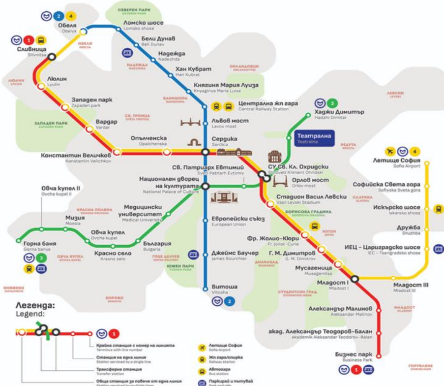
Şekil.2. Sofya Metrosu Ağ Haritası

Sofya tramvay ağı, Bulgaristan'ın başkenti Sofya'nın toplu taşıma sisteminin hayati bir parçasıdır. 1 Ocak 1901'de 23 km uzunluğunda tek yönlü hat ve 1000 mm ray aralığında hizmet veren 25 adet tramvay ile faaliyete geçti. 2006 yılı itibariyle tramvay sistemi yaklaşık 308 kilometre dar ve standart hatta tek yönlü olarak faaliyet veriyordu. Hattın büyük bir kısmı 1000 mm dar ve 40 km.lik kısmı da standart 1435 mm ray aralığına sahipti. Sofya'nın ilk standart hatlı tramvay hattı 1987'de açıldı. İkinci ve üçüncü standart hatlar ise sırasıyla 1995 ve 2010 yılında hizmet vermeye başladı. 2014 yılından itibaren eski model tramvayların çoğu hizmet dışı kaldı.